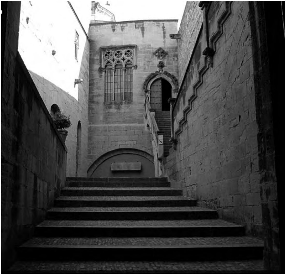
FIGURA 5. Palau del rei Martí a Poblet, 1409.