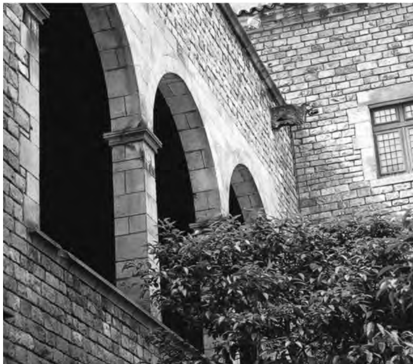
FIGURA 2. Galeria de Martí I adossada al mur del Tinell. Palau Reial Major de Barcelona.