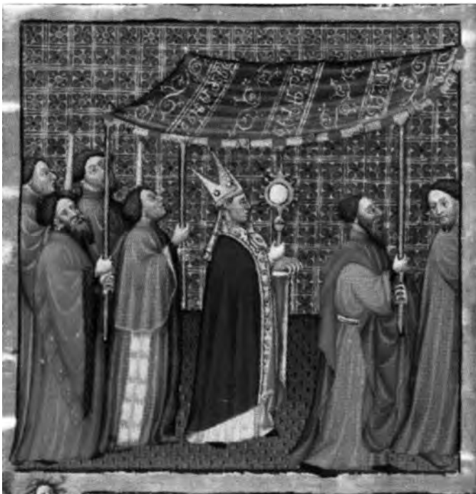
FIGURA 3. Breviari del rei Martí , f. 248. 1398-1403. Bibliothèque Nationale de France.