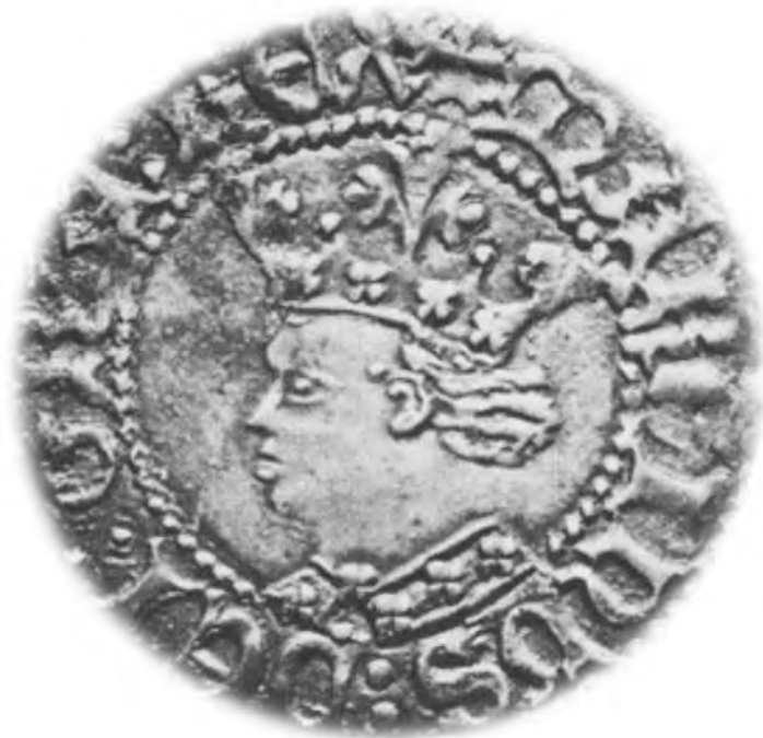
FIGURA 1. Croat del rei Martí I.